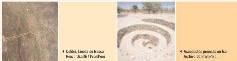
◀ Colibrí, Líneas de Nasca

Se exhibe una colección de piezas arqueológicas de las diferentes etapas de la cultura Nasca, cabezas trofeo, instrumentos musicales como antaras, textiles, fardos funerarios, etc. Estos hallazgos son el resultado de las excavaciones en el centro ceremonial de barro más grande del mundo: "Cahuachi". Además, en este museo se puede apreciar el canal de bisambra, que muestra el magnífico trabajo de ingeniería hidráulica de los nascas.