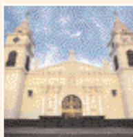
◀ Catedral de Ica