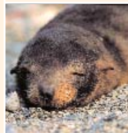
◀ Lobo de mar en Paracas

Culto especial a la Virgen del Carmen, a quien se conoce en la zona como La Peoncita. Para festejarla grupos de adolescentes ejecutan la Danza de los Negritos y de las Pallitas.