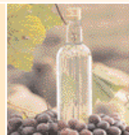
◀ Pisco peruano en Ica