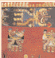
Manto Paracas